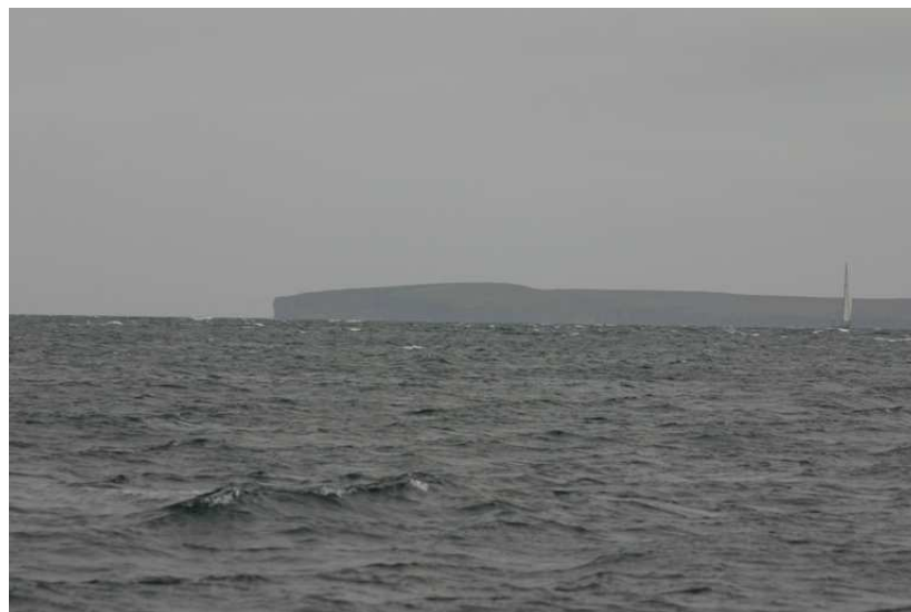
Horse of Copinsay

De hele nacht door wordt er op de motor gevaren en pas om 11:00 's morgens met een oosten wind wk 4 kan het zeil weer op.