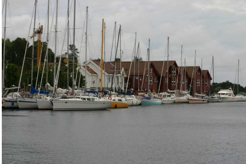
Nederlandse gezelligheid in Farsund