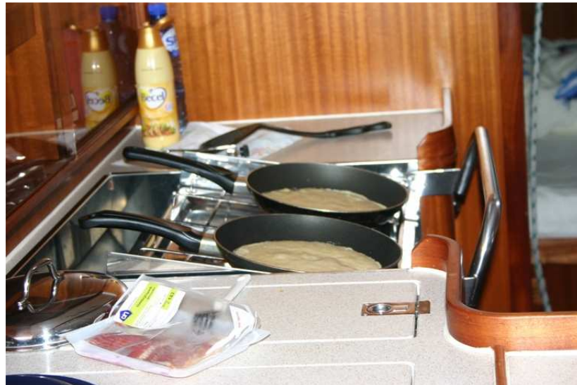
Pannenkoeken naturel en met spek

En dat doet deze handige jongen wel even met 2 koekenpannen..