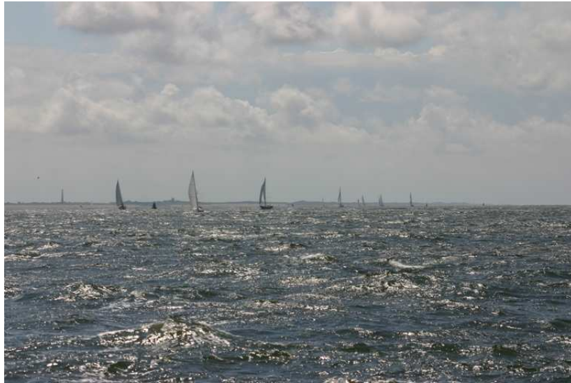
Altijd weer een mooi gezicht