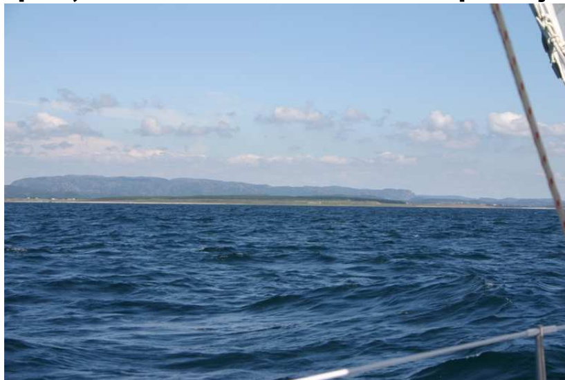
Zuid west Noorwegen

Spoel de kuip uit, orden de vallen en schoten en pak mijn boek weer.