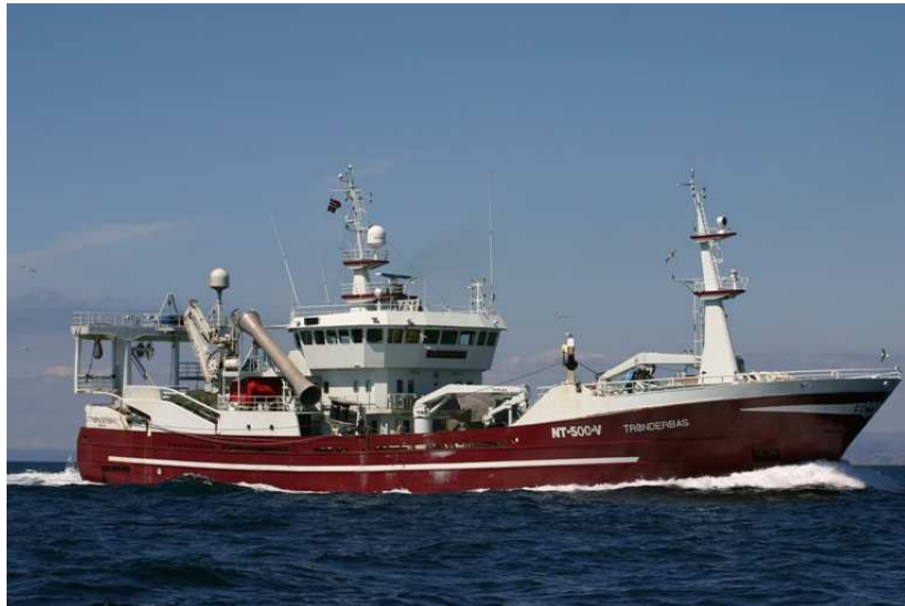
Noorse visser gedraagt zich als Urker

De aanloop van Farsund is wederom prachtig, tussen de rotsen door van eilandje naar eilandje.