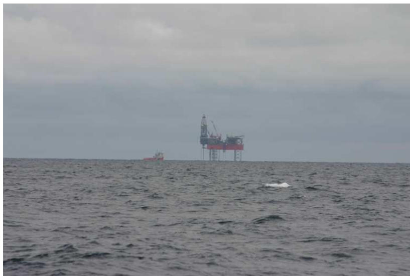
Birch Oil Field