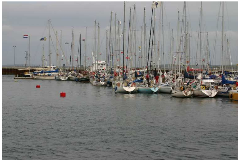
Een gezellig gebeuren in de haven van Kirkwall

Einde van de eerste tocht, nu even rust en later de Orkney's bekijken.